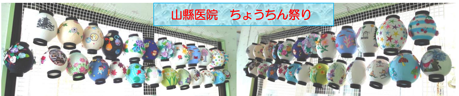
山縣病院 ちょうちん祭り

通所リハビリでは、 手のリハビリとして、作品づくりに 取り組んでいます。 見学や利用希望の方(要介護)は、 お気軽に受付に声をかけて下さい。 2階 通所リハビリ(デイケア)